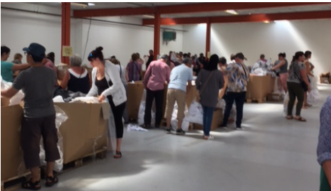
Britta 2. gilde

Denne gang har vi måttet betale os fra lidt goodwill, men vi er stadig tilfredse med resultatet og er friske, når der igen står 64 nye paller klar til os.