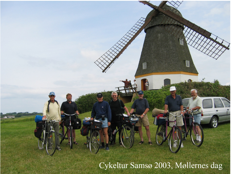
Cykeltur Samsø 2003, Møllernes dag