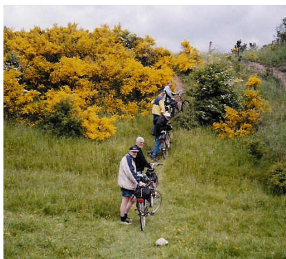
Cykeltur Samsø. Jungletur