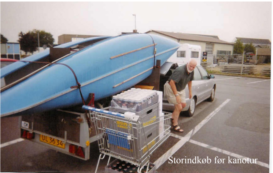
Storindkøb før kanotur