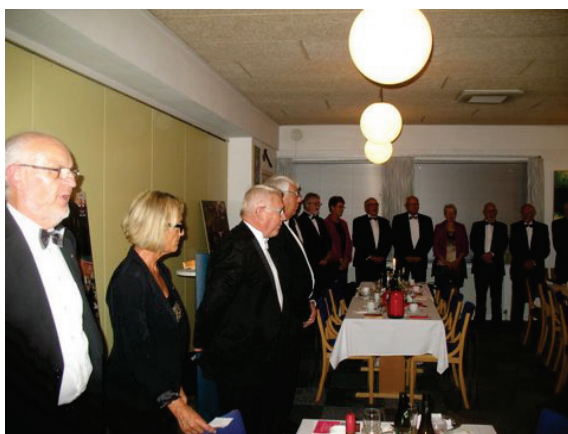
2 billeder fra afslutning af jubilæumsgildehallen