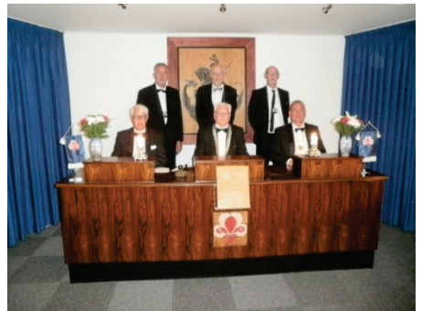
Ledelsen ved jubilæet