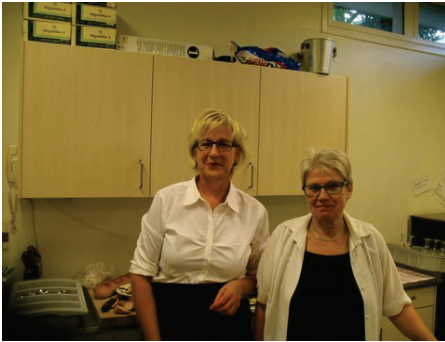
Britta og Co.