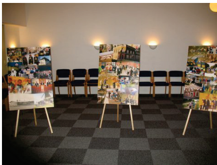
Plakater med 3. Gilde aktiviteter